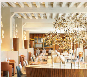
Un menu dégustation à Epona