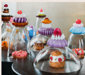
Un tea time intime au Dôme

Découvrez nos idées cadeaux pour ravir le cœur de votre bien aimé.