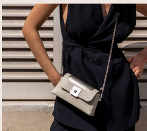
Le sac Lolo Chatenay et InterContinental Lyon