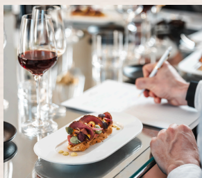
Un atelier œnologique au Dôme